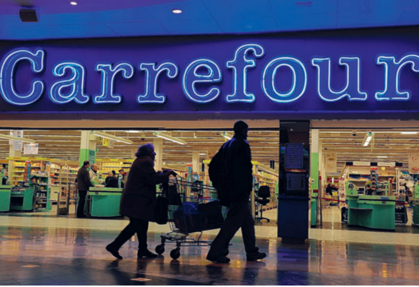
Carrefour geeft naar verwachting op 24 februari meer uitleg over zijn logistieke reorganisatie.